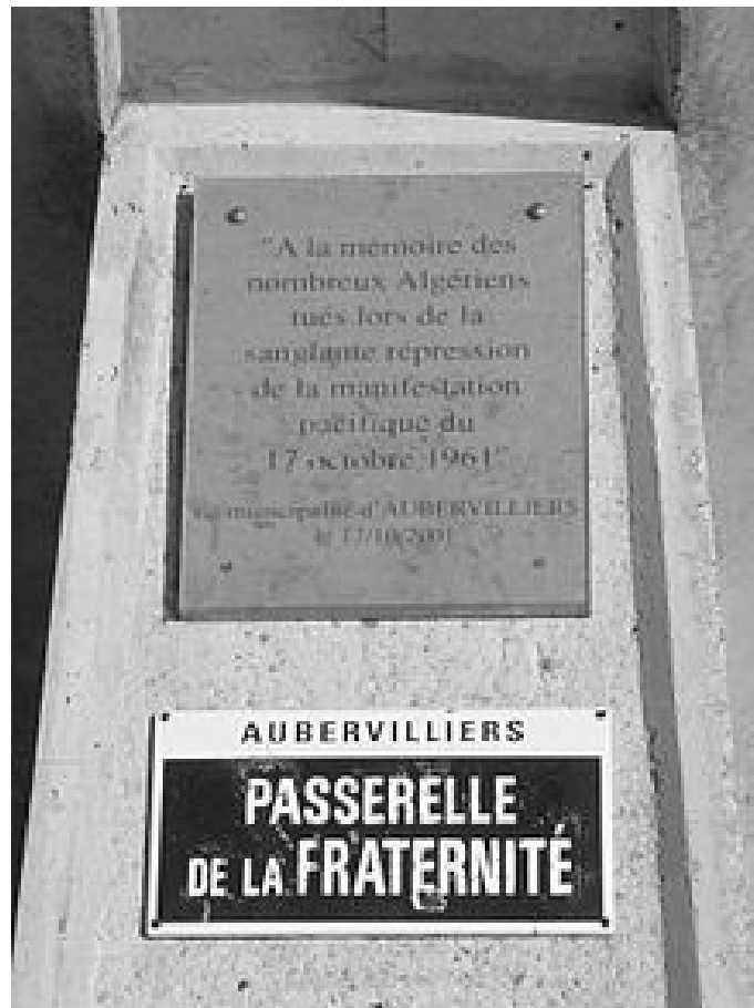
Plaque commémorative à Aubervilliers. On a noté celle du Pont St Michel dans le corps de la recherche.