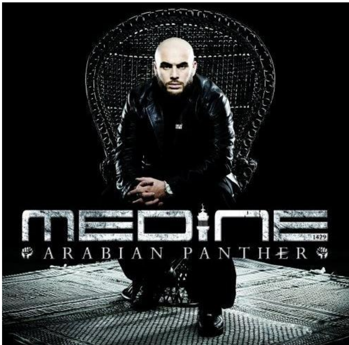
Pochette de l'album du rappeur Médine (voir page suivante pour la comparaison avec Huey Newton).