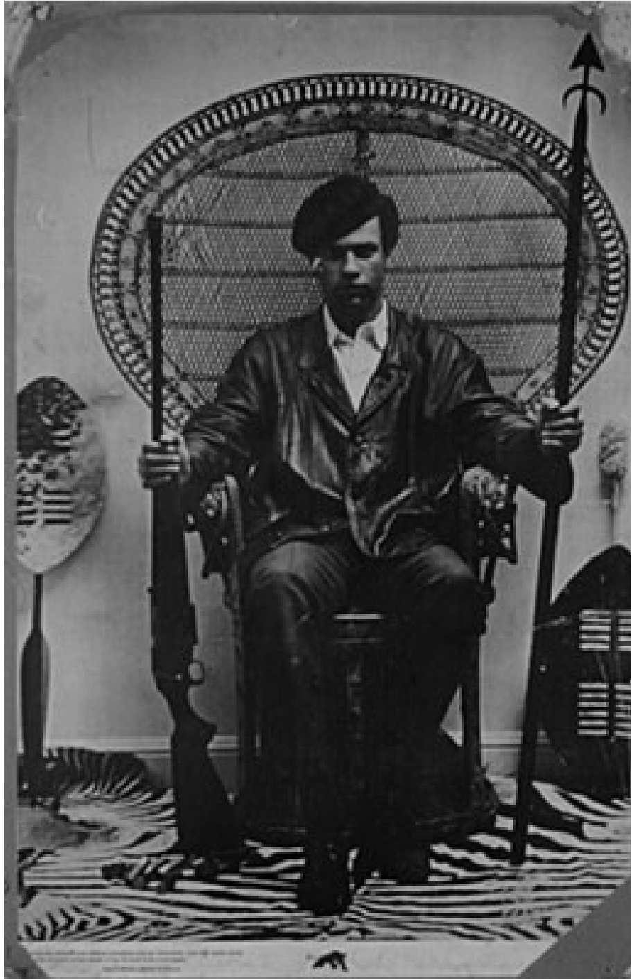
Huey Newton fondateur des « Black Panthers ».